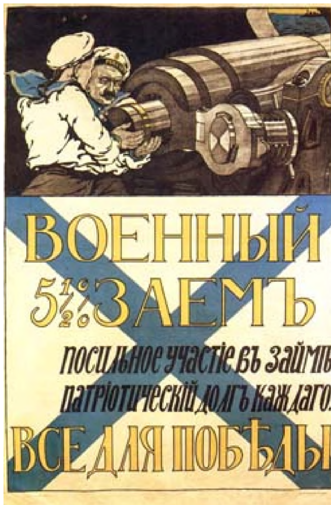
Рис. 2 – Плакат «Военный заем»

должна быть обеспечена свобода выхода из Чёрного и Балтийского морей, причём ключи от Чёрного моря должны быть в руках России» [2]. С настроениями делегатов «Славянского союза» перекликалась статья в «Морском сборнике» под авторством Н. Нордмана «Война с Турцией и её последствия», призывавшая решить при помощи оружия задачи контроля Россией черноморских проливов [3].