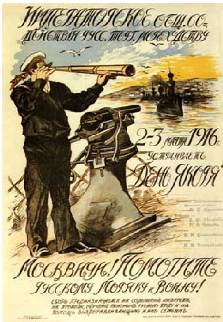
Рис. 3 – Благотворительный плакат

Если говорить о Турции, то русская военная пропаганда на флоте постоянно пыталась изобразить её как несерьёзного противника. Вот заметка журнала «Морской сборник», вышедшая в разделе «Морская хроника»: «Ночью 29 ноября 1915 г. доставлен в Одессу задержанный у Тарутина турецкий отряд в 25 человек. Турки производят жалкое впечатление» [6].