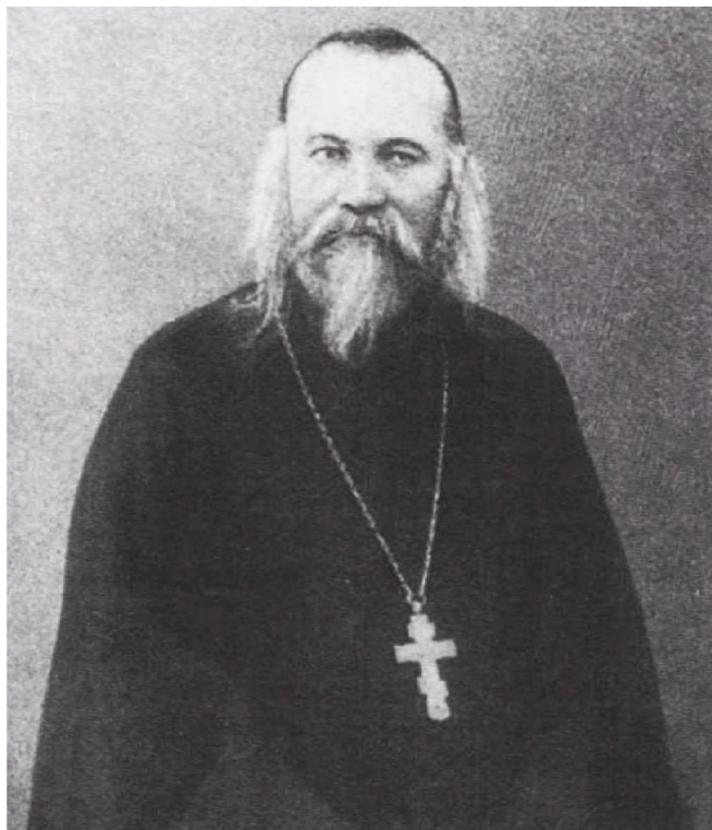
Рис. 5 – Отец Антоний

вой врач. Одновременно отмечалась геройская гибель лейтенанта Рогузского, подорвавшего не вооруженный артиллерией транспорт «Прут», чтобы он не достался туркам, и отчаянная атака командира миноносца «Лейтенанта Пушкин» на крейсер «Гeben».